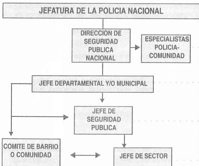
GRAFICO N° 2: Organigrama de la relación policía – comunidad y derechos humanos.

Las relaciones entre las diferentes instancias a lo interno de la institución Policial para la implementación de la Política Policía Comunidad y Derechos Humanos se ilustra en el siguiente gráfico: