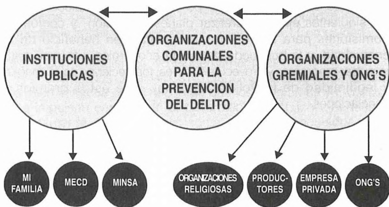
GRAFICO 1: RELACION DE LOS COMITÉS CON INSTITUCIONES Y OTRAS ORGANIZACIONES

El conjunto de actores y sectores sociales que interactúan en la relación Policía – Comunidad se refleja en el siguiente diagrama: